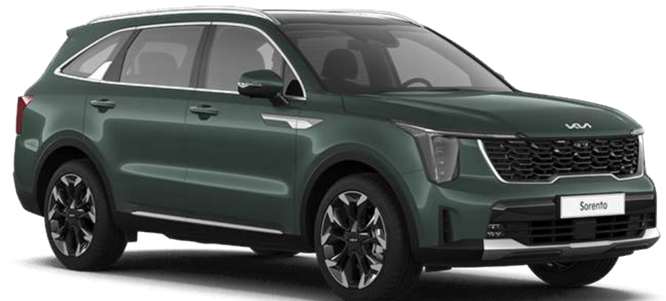
Cityscape green (CGE)