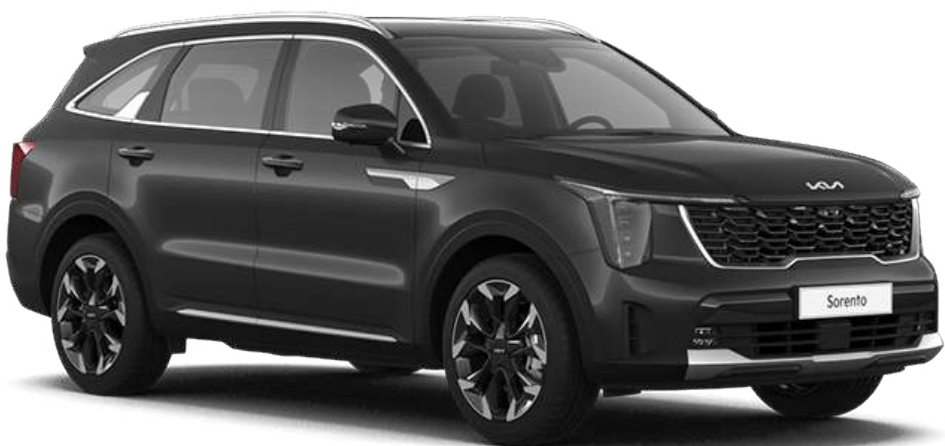
Interstellar Gray (AGT)