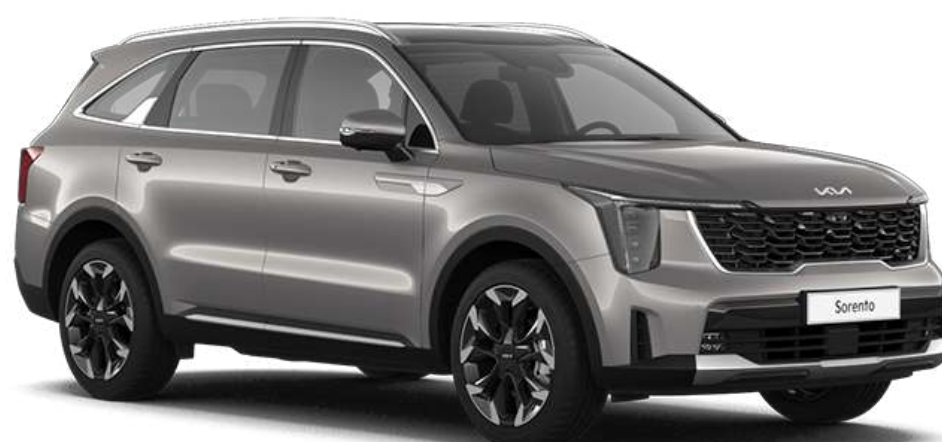
Volcanic Sand Brown (BNQ)