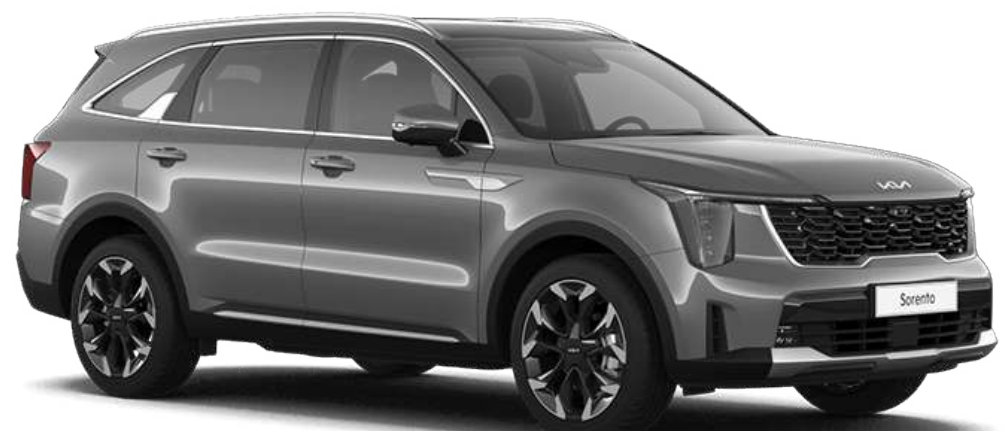
Steel Gray (KLG)