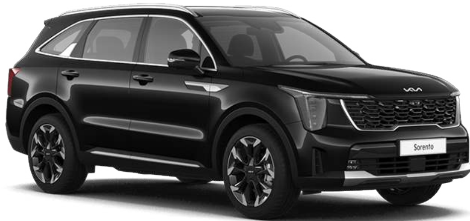
Aurora Black Pearl (AWB)